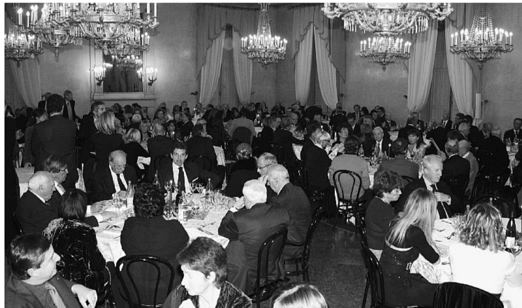
Un momento della serata al Circolo di Lettura