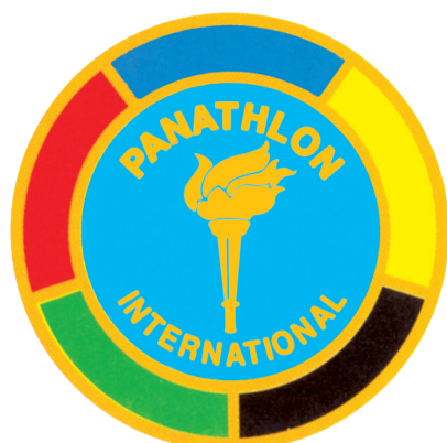
CLUB DI PAVIA